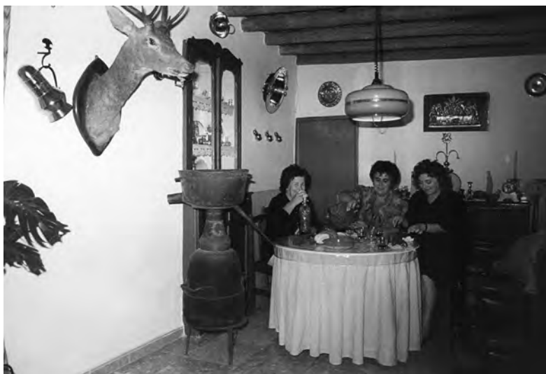
Esparragosa de Lares 1994. Un grupo de vecinas.

nógrafo en el campo también se da la casuística siguiente: a veces en las poblaciones que haces trabajo encuentras, por casualidad, a personas que disponen de una información valiosa sobre pueblos distintos al suyo, o sobre el suyo pero entrevistados en otras poblaciones por trabajar en estas. Es lo que me ocurrió, por ejemplo, con don José Capilla en Puebla, quien me facilitó una información precisa sobre Esparragosa. Hay ejemplos, asimismo, de matrimonios mixtos en los que cada cónyuge son oriundos de comunidades diferentes, a veces próximas y otras más alejadas. En mi experiencia conté con varios en los que la aportación complementaria de ambos fue inestimable.