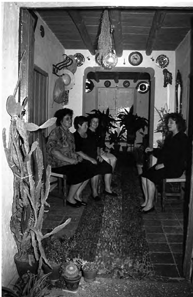
Informantes de Esparragosa de Lares

por sus peculiaridades, pequeñas demográficamente y algo aisladas, tales como Villarta, Bohonal, Tamurejo, etc., también forman parte de una misma realidad diversa. Además he obtenido información, aparte otros municipios, de los tres anejos o aldeas: Pelоче (Herrera del Duque), Bohonal (Helechosa de los Montes) y Galizuela (Esparragosa de Lares).