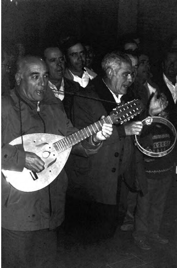
Grupo de auroros (Garbayuela)

Mi aportación, de alguna manera presentada en forma dialógica en interacción interpersonal , la he diseñado mediante la lógica de la intersubjetividad entre lo que dicen los informantes y lo que observa y considera el etnógrafo . Para dar frescura al texto y “ceder la voz” a los primeros priorizo, mediante la reproducción literal de testimonios, en entrecomillados y en cursivas, pasajes y relatos significativos de las entrevistas. De tal manera pongo el acento en la percepción y el punto de vista de los actores locales , transcribiendo los argumentos más reveladores de los informantes clave. Naturalmente sus respuestas tienen mucho que ver, como no puede ser de otra forma, con las preguntas que les formulé. Ahora bien, soy consciente de que las manifestaciones de las personas entrevistadas están en cierto grado sesgadas; es decir, las respuestas a veces revelan la realidad, no tanto como realmente es, cuanto como es percibida y expresada por los entrevistados . Soy de la opinión, sin embargo, que