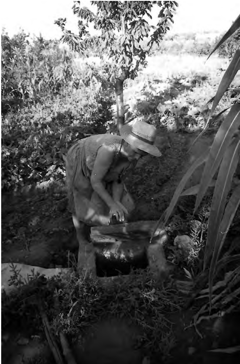
D ª Petra Rodríguez (Valdecaballeros)

De los 64 informantes conocemos la edad aproximada de 40. Es decir, del 62'5% del total. La edad media ronda en torno a los 55 años. Ahora bien, aunque la mayoría de ellos se encuentra en la franja de entre los 40 y lo 60 años, también entrevisté a algunos entre los 30 y los 40, y a otros por encima de los 70 años.