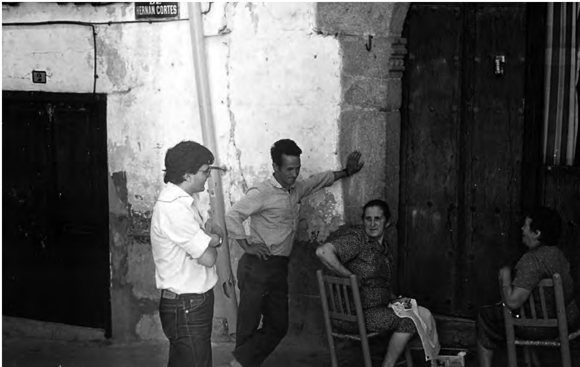
El etnólogo y los informantes

Cientificidad no significa obligadamente descompromiso o anoxia emocional. De manera que defiendo como posición metodológica la implicación del investigador en la sociedad analizada y la aplicación del conocimiento derivado para contribuir a su transformación . De tal manera asumo la antropología como fuente de conocimiento aplicado e implicado con la realidad estudiada. Porque la investigación antropológica en entornos regionales-comarcales-locales, sobre temas etnográficos puntuales, debe ser aplicada y comprometida con la propia realidad donde se inserta el investigador , pues éste tiene su campo de acción inmediato en el propio entorno sociocultural donde desarrolla su trabajo. Como es conocido, en antropología existe una relación dialéctica entre la teoría y la praxis. Mi estudio sobre realidades etnográficas concretas en la Siberia extremeña, por otra parte, pretende contribuir al conocimiento y comprensión no tópica, mixtificada o mitificada, del proceso de cambio que desde hace décadas se está produciendo en la denominada cultura rural-tradicional en sus elementos materiales, conductuales y mentales en tiempos de globalización asimétrica.