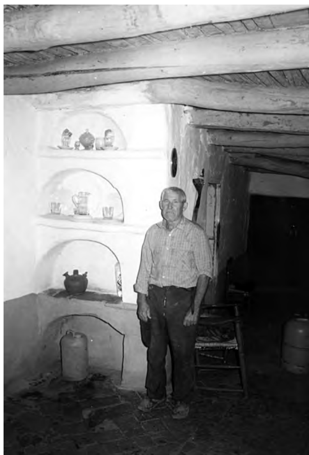
Herrera del Duque. Campesino en una vivienda tradicional

De otro lado, en un par de casos fui consciente de que la información que me transmitían y asignaban los informantes a un cierto lugar, en realidad se refería a otra población. Recuerdo en este sentido la entrevista que mantuve con el párroco de Talarrubias, quien con alguna confusión “involuntaria” mezclaba la información que le solicitaba con la de Tamurejo, su pueblo. Y a veces también tuve dudas sobre la información que recabé cuando en una misma población entrevisté al mismo tiempo a varios informantes de distintas localidades. Porque se entremezclaban las respuestas sobre los temas que preguntaba sin distinguir por parte de los informantes la población a la que se referían. Esta circunstancia ha supuesto en ocasiones (Talarrubias, Puebla de Alcocer..) algunos problemas y una dificultad añadida. Naturalmente, cuando me surgían dudas traté de resolverlas con “repreguntas” y “enfrentando” los pareceres de unos y otros.