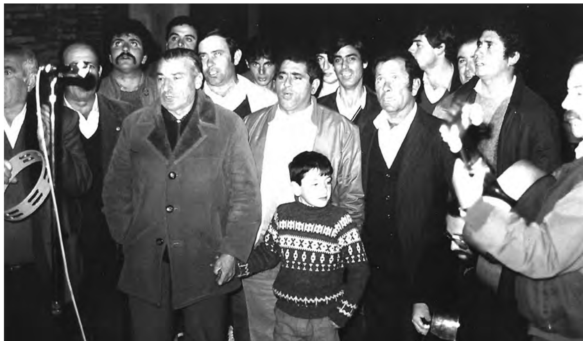
Auroros (Garbayuela)