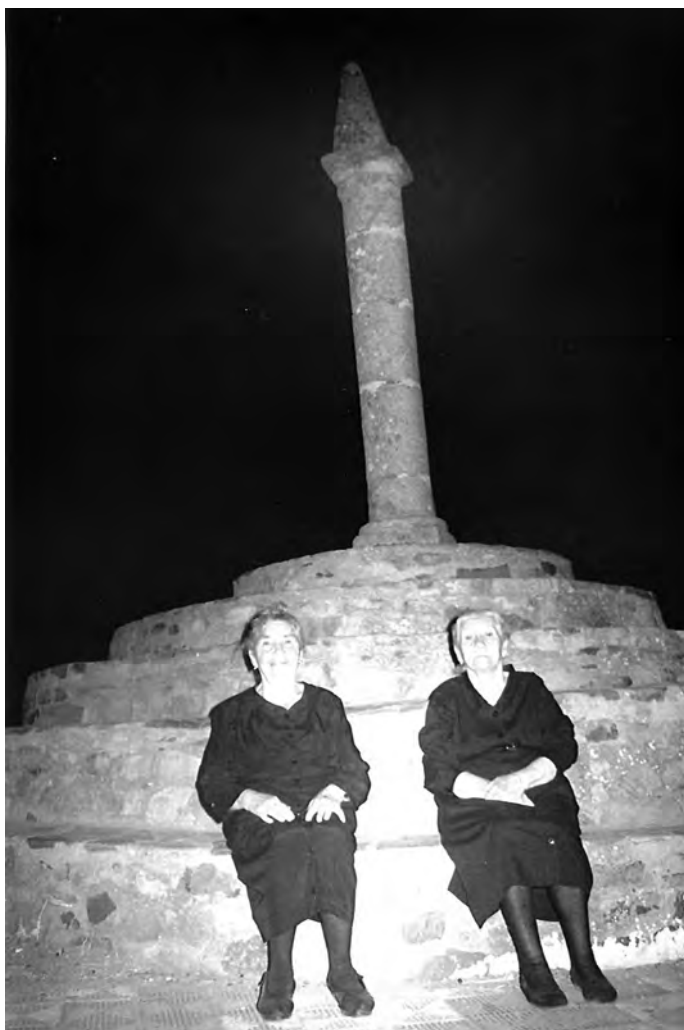
Fuenlabrada de los Montes. "El rollo" o "Pingote" 1994. Dos vecinas

La nueva lista de supuestos informantes "viabiles" fue concretándose y ampliándose a medida que avanzaba el trabajo sobre el terreno. Porque, además, mis primeras visitas y relaciones interpersonales con gentes de la zona sirvieron, entre otras cosas, para distinguir e ir seleccionando en cada comunidad, de forma particular y matizada, las personas que tras algunas conversaciones previas me dieron la impresión de que sus conocimientos sobre las realidades objeto de estudio pudieran ser útiles; en unos casos como informantes que pudieran transmitir una idea de conjunto de la cultura local; y en otros, comunicando una información precisa sobre aspectos concretos y puntuales. Es decir, visiones específicas por ámbitos temáticos. También encontré entre ellos a quienes en su momento su-