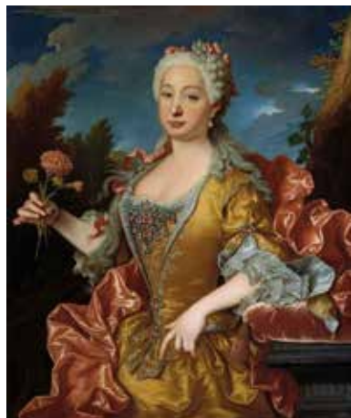
Bárbara de Braganza como Princesa de Asturias. Cuadro de Jean Ranc. Museo del Prado.

Hija del rey Juan V de Portugal casó con el hijo de Felipe V de España y María Gabriela de Saboya, futuro rey Fernando VI. La boda se celebró en Badajoz el 20 de enero de 1729 en un suntuoso palacete de madera construido sobre el río Caya.