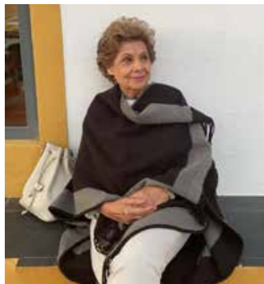
Fuente: texto por Juan Antonio Espejo Díaz.

Aprendió y practicó el oficio de comerciante trabajando en los almacenes “La Giralda” que fue uno de los comercios más emblemáticos de Badajoz, ubicado en la Plaza de la Soledad y con sus experiencias con el trato con los clientes nacieron sus inquietudes profesionales como empresaria.