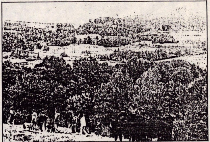
Se habló con los ganaderos sobre la problemática de la zona.

cabras, nos cuenta su situación, sus dificultades, su vida, su orgullo.