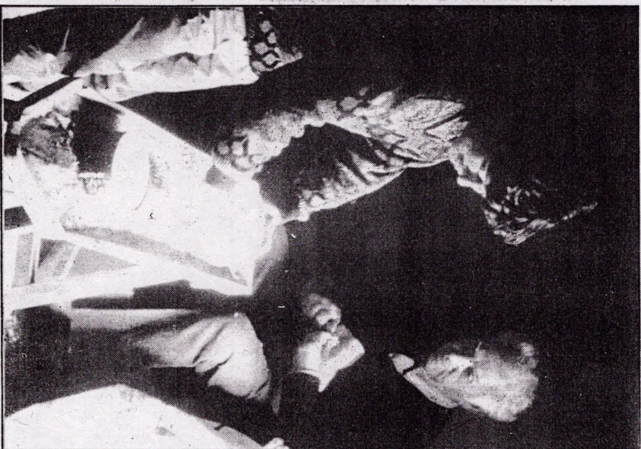
Cartel anunciador de las IV Jornadas de Educación Ambiental.

Las jornadas se desarrollarán en la Residencia de Tiempo Libre de Baños de Montemayor y para su realización se ha contado con la colaboración de la Dirección General de la Juventud de la Consejería de Educación y Cultura de la Junta de Extremadura y las Unidades de Programas Educativos del Ministerio de Educación y Ciencia de Cáceres y Badajoz.