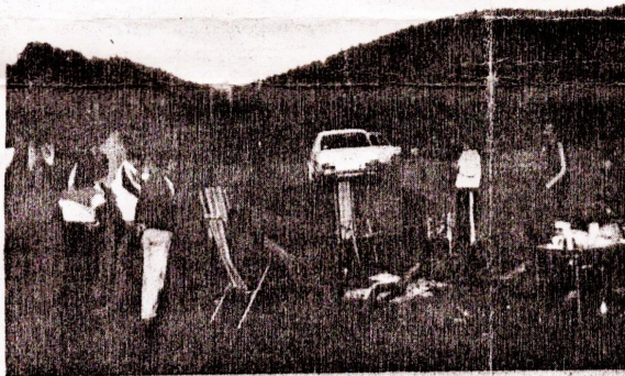
Las acampadas, otro de los fines de este colectivo. En la foto, algunos profesores durante una de estas acampadas en Monfragüe

A nivel de localidad, cada cual se vale de los medios que tenga a su alcance. En lo que respecta al colegio Virgen de la Vega, al que pertenezco, los gastos han sido de momento afrontados por el propio colegio, para lo sucesivo podremos contar con alguna aportación de las entidades bancarias de la localidad, centro cultural, Ayuntamiento, etc., quienes así nos lo han manifestado, actitud que agradeceremos desde este medio.